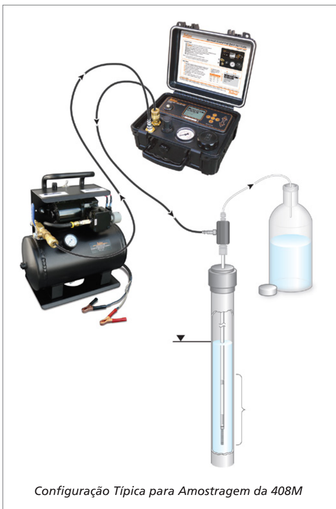
Configuração Típica para Amostragem da 408M

Para purgar e coletar amostras de até 7 Micro Bombas de Válvula Dupla em um único local, disponibilizamos um Conjunto Coletor Multipurga.