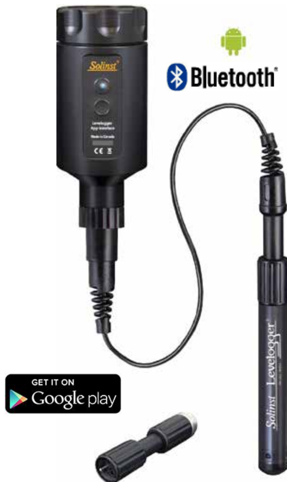
Interface Bluetooth do Aplicativo